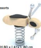
Abeille sur ressorts