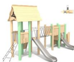
Cabane sur mesure L 906 x l 393 x H 440 cm