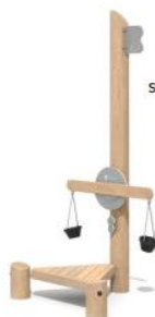
Structure de jeux de sable