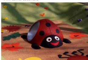
Mini tunnel coccinelle

Jeux en robinier et acier inoxydable gamme Buglo